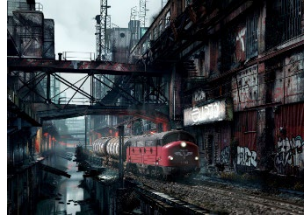
Dystopian industry district (2024)

Lok des NOHAB-Typs AA16 des Braunschweiger EVU BSBS, beschriftet als My 1142 in der Farbgebung des früheren Eigentümers DSB (Modell von Tillig) in einer durch Industriegebiete am Rande Berlins inspirierten virtuellen Umgebung, die mit der KI-Engine Midjourney erstellt wurde.