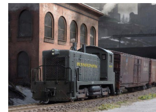
Declined industries II (2023)

Die Lok des Typs FP7 der Chicago, Burlington & Quincy Railroad stammt aus einer Kleinserie von Tillig. Der Caboose auf dem rechten Gleis ist von Lok-N-Roll. Für die virtuelle Umgebung wurde ein Screenshot der Gamerin Larah Johnson aus dem Computerspiel „Cyberpunk 2077“ verwendet.