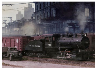
Urban freight (2017)

Für die Erstellung der virtuellen Umgebungen wurden als Ausgangsmaterial zunächst Screenshots von Computerspielen verwendet, die von Leuten aus der Gamer-Szene zur Verfügung gestellt wurden. Inzwischen haben sich die meisten dieser Gamer aus dieser Szene wieder zurückgezogen und anderen Projekten zugewandt. Als neue Entwicklung ergab sich jedoch die Möglichkeit, die virtuellen Umgebungen mit KI-Bildgeneratoren zu erstellen. Bei den neueren Bildern, bei denen diese Technik angewendet wurde, wurde die KI-Engine von Midjourney genutzt. Dabei wurde teilweise die Ästhetik bekannter Games aufgegriffen, so dass diese Darstellungen mit den früheren Bildern ein Kontinuum bilden.