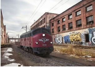
The European F-unit II (2023)

Lok des NOHAB-Typs AA16 des Braunschweiger EVU BSBS, beschriftet als My 1142 in der Farbgebung des früheren Eigentümers DSB (Modell von Tillig) in einer durch Industriegebiete am Rande Berlins inspirierten virtuellen Umgebung, die mit der KI-Engine Midjourney erstellt wurde.