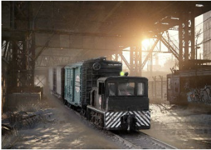
Critter under steel structure (2024)

Eine Lok des NOHAB-Typs AA16 des Braunschweiger EVU BSBS, beschriftet als My 1142 des früheren Eigentümers DSB (Modell von Tillig), durchfährt mit zwei GATX-Kesselwagen (Modelle von Igra) in einer fiktiven nahen Zukunft ein dystopisch anmutendes Industriegebiet am Rande einer europäischen Großstadt. Die virtuelle Umgebung wurde mit der KI-Engine Midjourney erstellt.