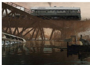
The bridge (2019)

Die Wagenmodelle stammen vom Modellbahnhof Geringswalde und von Lok-N-Roll. Für den Vordergrund wurde ein Screenshot des Gamers Xanvast aus dem Computerspiel „Homefront: The Revolution“ verwendet. Der Hintergrund entstand aus einem Screenshot des Gamers Anthemios aus dem Game „The Division“.