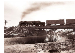
Steaming through the wasteland (2019)

Die Lok ist eine M62 (entspricht der DR-Baureihe 120) von Roco. Hinter der Lok läuft ein achtachsiger Großraumkesselwagen vom russischen Hersteller Peresvet. Für die virtuelle Umgebung wurde ein Screenshot der Gamerin Larah Johnson aus dem Computerspiel „Metro Exodus“ verwendet.